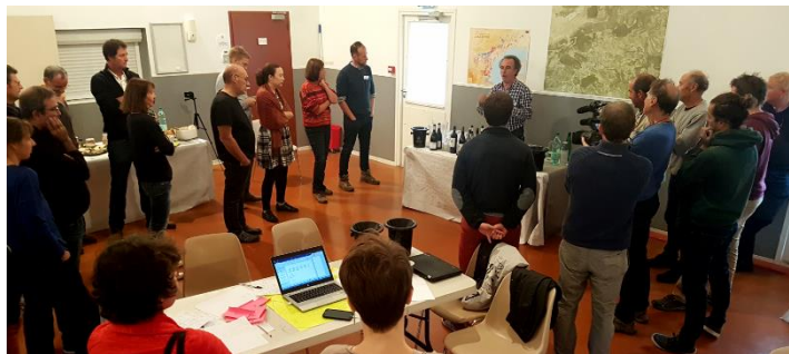
Dégustation de vin offerte par l'AOC Languedoc

L'objectif (entre 50 et 80 personnes) a été atteint et le nombre de participants s'est avéré bien adapté aux méthodes d'animation retenues (6 groupes, visites de terrain, séquences plénières) et aux capacités de la salle. Surtout, l'équilibre entre les catégories d'acteurs a été une condition forte du succès, en évitant un événement "trop professionnel viticole" ou "trop recherche". La diversité concernait aussi différentes "sensibilités", par exemple des approches agroécologiques plus ou moins marquées, des orientations plus ou moins techniques, une diversité de disciplines scientifiques pour les chercheurs... Le noyau dur des "31 travailleurs actifs" présents sur les 24h (avec une interruption de 6 h pour sommeil) a été suffisant pour assurer la continuité des actions, même s'il aurait pu être plus important. Il apparaît de fait difficile de mobiliser sur 24h un nombre important d'acteurs de