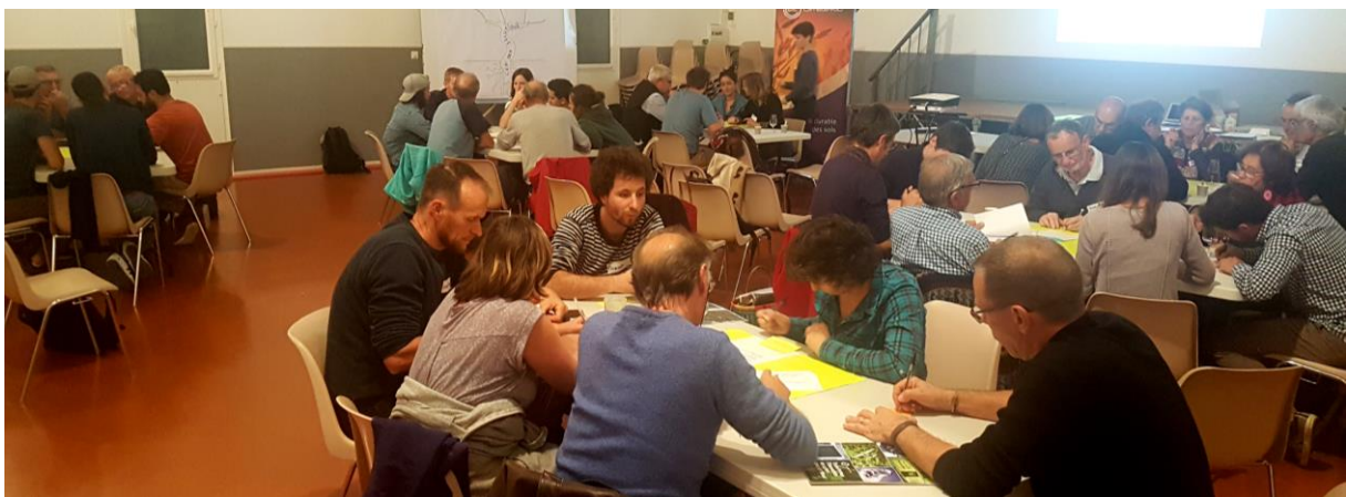
Les participants en plein World Café

Le World Café se déroule en 3 phases : la première pour lister les problèmes en lien (ou non) avec les deux thèmes proposés, une deuxième pour approfondir au moins un des problèmes évoqués (causes, conséquences, contexte...), et une dernière phase pour identifier une ou plusieurs solutions à ce problème, qui pourraient être développée à Murviel.