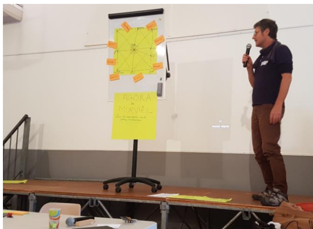
Présentation de l'Agora citoyenne

Le projet du groupe a alors changé de nature et d'échelle en proposant de développer une "agora citoyenne de Murviel" pour favoriser l'émergence de projets permettant de mettre en œuvre sur le territoire de la commune cette transition écologique inspirée de la permaculture. Il s'agit de mettre en relations les activités des diverses associations et des acteurs du territoire, de partager les expériences et les savoirs, de proposer des moments de créativité et de recherche de solution, à l'image même du Climathon® (une forme de pérennisation du Climathon® !). Le projet s'élargit donc à de nombreuses activités concernées par le changement climatique (atténuation des émissions de gaz à effet de serre et adaptation) et qui constituent l'écosystème local dans lequel évolue le vignoble et les viticulteurs. A travers une Agora des personnes et des projets, Murviel serait à même d'organiser une transition à grande échelle pour son vignoble et son territoire.