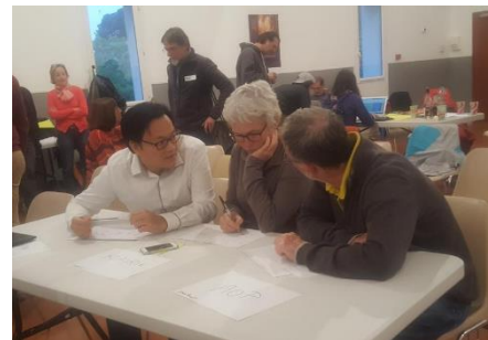
Délibération du Jury