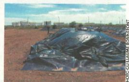
Les terrains de l'ancienne raffinerie d'Exxon Mobil à Frontignan, en cours de dépollution, accueilleront une gare et des bureaux.