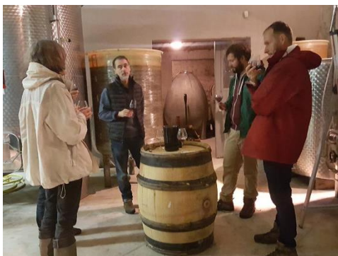
Dégustation au caveau

Le Climathon® a redémarré tôt le samedi, à 8h, par une séance de yoga ouverte à tous les participants. Si l'activité peut prêter à sourire, elle fut très appréciée par les participants qui avaient accepté de se lever tôt.