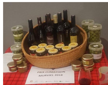
Prix du Climathon® de Murviel

La récompense a été constituée par un assemblage de produits locaux : meilleurs vins des 8 domaines de Murviel, olives, tapenades et miell. Le prix était présenté à tous durant les 24h. Il est apparu important d'avoir un prix "partageable" puisqu'il concerne une équipe dont la taille n'est pas forcément connue à l'avance... et qu'il faut prévoir la possibilité de deux projets primés (ce qui a été le cas).